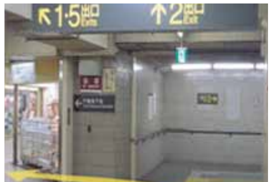
⑥真っ直ぐ歩いて来ますと2番出口が見えて参ります。2番出口の手前を左に曲がりすぐ右へ進んでください。