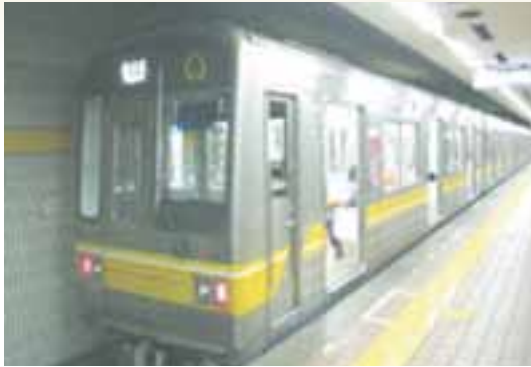
①名古屋駅より市営地下鉄東山線へご乗車下さい。最後尾の車両にご乗車することをオススメいたします。