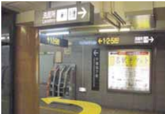
⑤右に曲がりすぐの突き当りを左へ歩いてください。