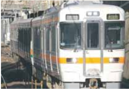
①名古屋駅よりJR中央本線へご乗車下さい。