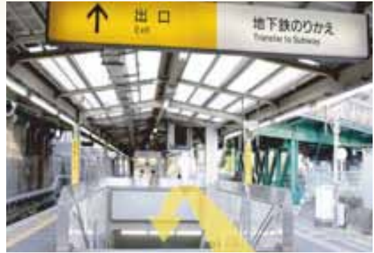
②名古屋駅より3つ目の「千種（ちくさ）駅」で下車下さい。下車しましたら地下鉄の乗り換え口（地下）へお降り下さい。