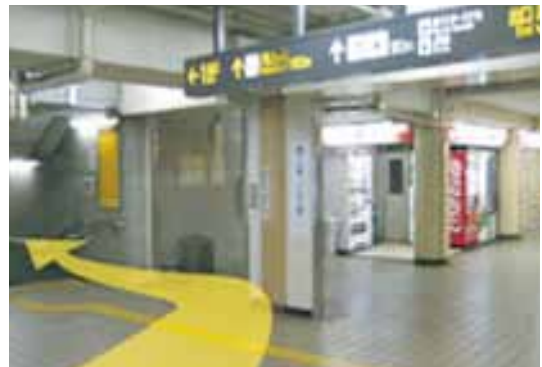
④改札口を抜け左手に進んでください。