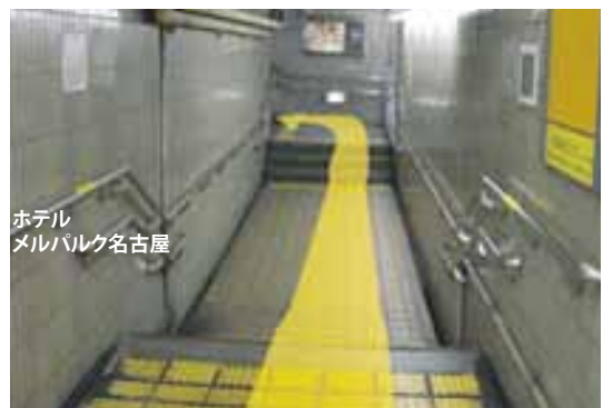
⑧右に曲がりましたら道なりに階段を上り、出たところの横断歩道を渡った先がホテルとなります。