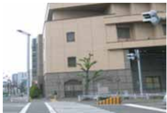
⑥出たところの横断歩道を渡った先がホテルとなります。