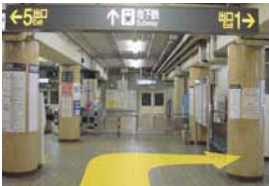
⑦直進してきますと再度、地下鉄の改札が見えてきます。改札の手前1番出口を右に曲がってください。