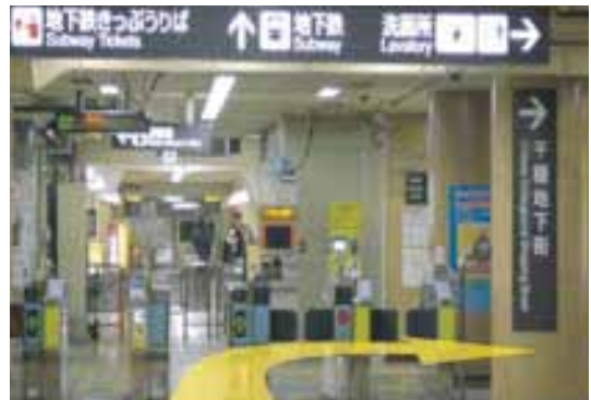
④真っ直ぐ歩きますと地下鉄の改札が見えて参ります。この改札の手前を右に曲がってください。