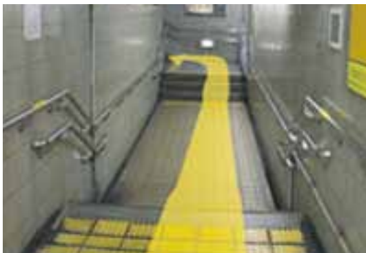
⑤地下鉄1番出口の階段を上って下さい。