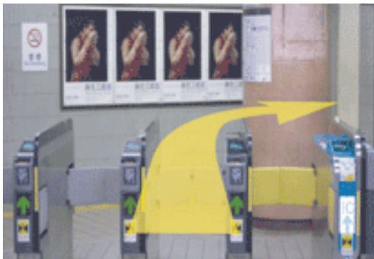
③階段を下りて改札口を抜け右手に真っ直ぐ進んでください。