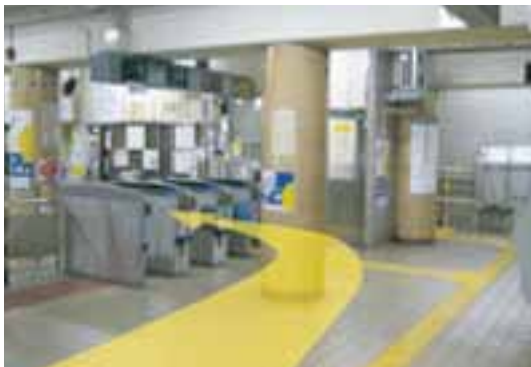
③階段を上りきりましたら前方左手に改札口があります。