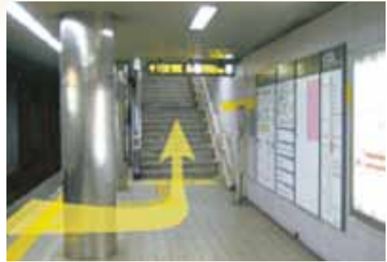
②「千種（ちくさ）駅」で下車しましたら、左手の階段を上ってください。